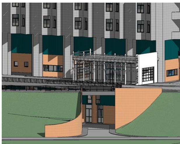
Aspetto architettonico del nuovo volume