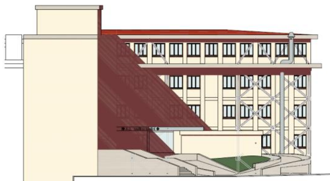
P.O. di Iseo