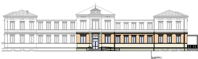
PROGETTAZIONE DEFINITIVA ED ESECUTIVA RELATIVA ALLE OPERE INTEGRATIVE ANTISISMICHE EDIFICIO TRIFOLGIO E VANO SCALA INGRESSO PRINCIPALE DEL P.O. DI ISEO