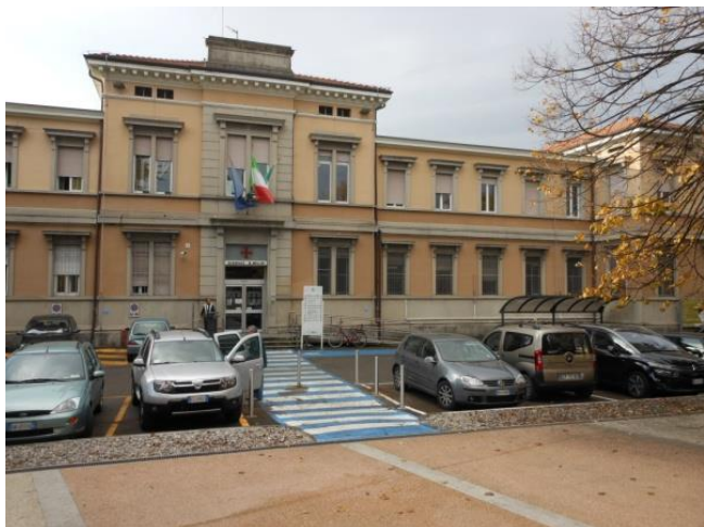
PROGETTAZIONE DEFINITIVA ED ESECUTIVA RELATIVA ALLA REALIZZAZIONE DEI LAVORI DI MESSA A NORMA DEL CUP PRESSO IL P.O. DI CHIARI